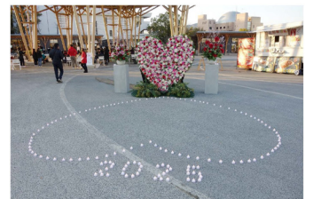
中央モニタメント